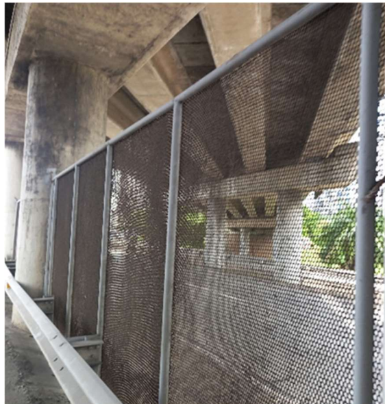
FOTO 2: Evidencia de primeros metros del cercado de malla expandida en el 14k+400; Atlapa, en sentido a Paitilla. La foto deja en evidencia el óxido y corrosión del cercado.

FOTO 1: Evidencia de primeros metros del cercado de malla expandida en el 14k+400; Atlapa, en sentido a Paitilla. La foto deja en evidencia el óxido y corrosión del cercado.