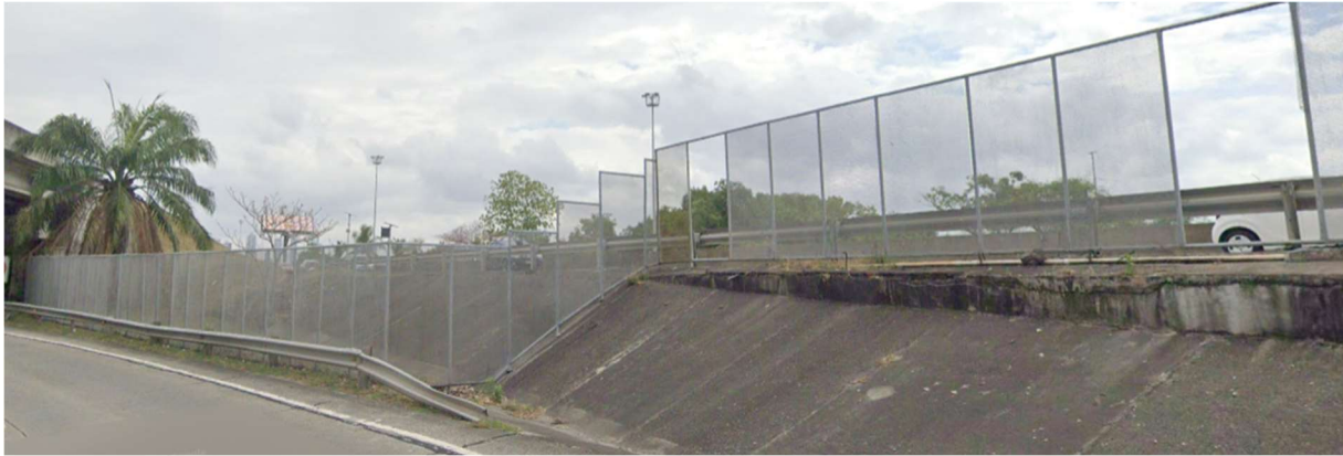
FOTO 6: Evidencia panorámica de parte final del cercado de malla expandida en el 14k+400; Atlapa, en sentido a Paitilla. La foto deja en evidencia el óxido y corrosión en ciertas partes del cercado.