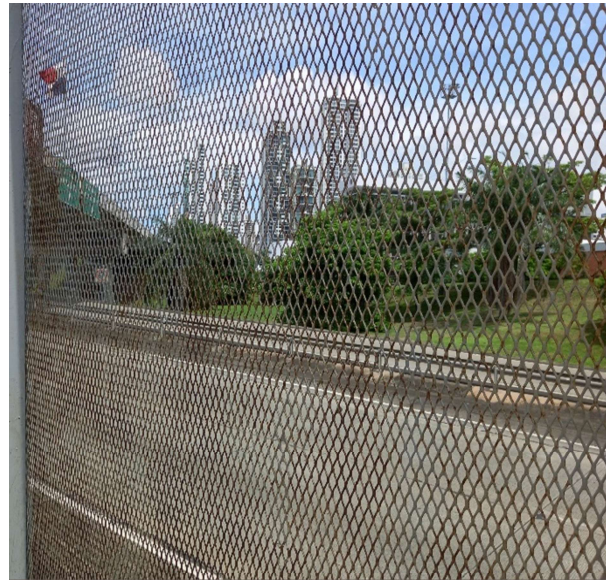
FOTO 5: Evidencia panorámica del cercado de malla expandida en el 14k+400; Atlapa, en sentido a Paitilla. La foto deja en evidencia el óxido y corrosión del cercado.

FOTO 4: Evidencia más de cerca del cercado de malla expandida en el 14k+400; Atlapa, en sentido a Paitilla. La foto deja en evidencia el óxido y corrosión del cercado.