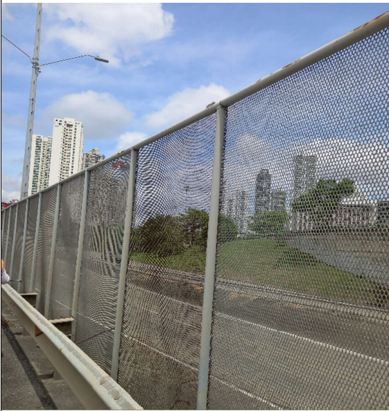
FOTO 4: Evidencia más de cerca del cercado de malla expandida en el 14k+400; Atlapa, en sentido a Paitilla. La foto deja en evidencia el óxido y corrosión del cercado.

FOTO 3: Evidencia de mitad del cercado de malla expandida en el 14k+400; Atlapa, en sentido a Paitilla. La foto deja en evidencia el óxido y corrosión del cercado.